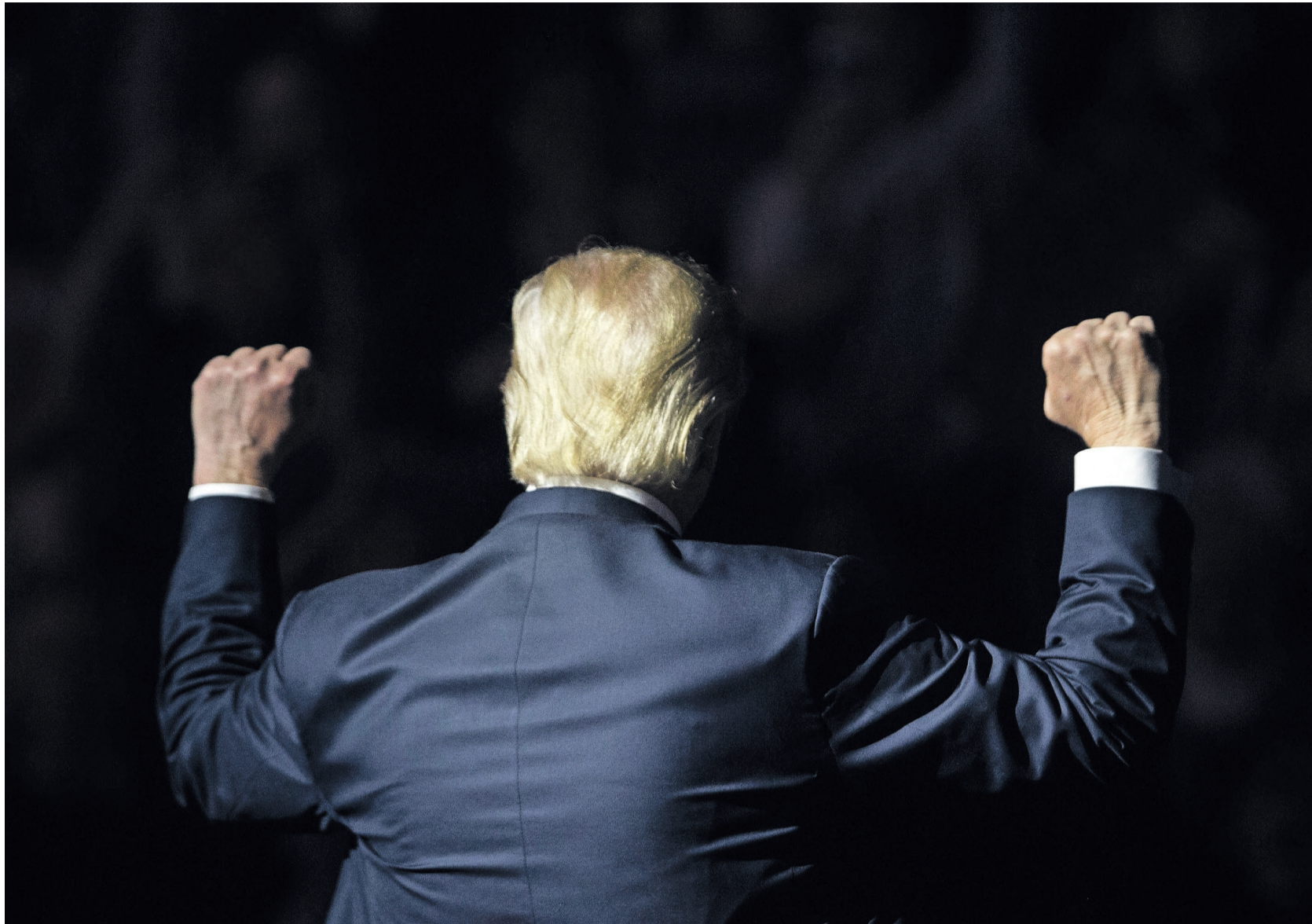
Das Einzige, was ihn an anderen Menschen interessiert, ist ihre Unterwerfung: Donald Trump.