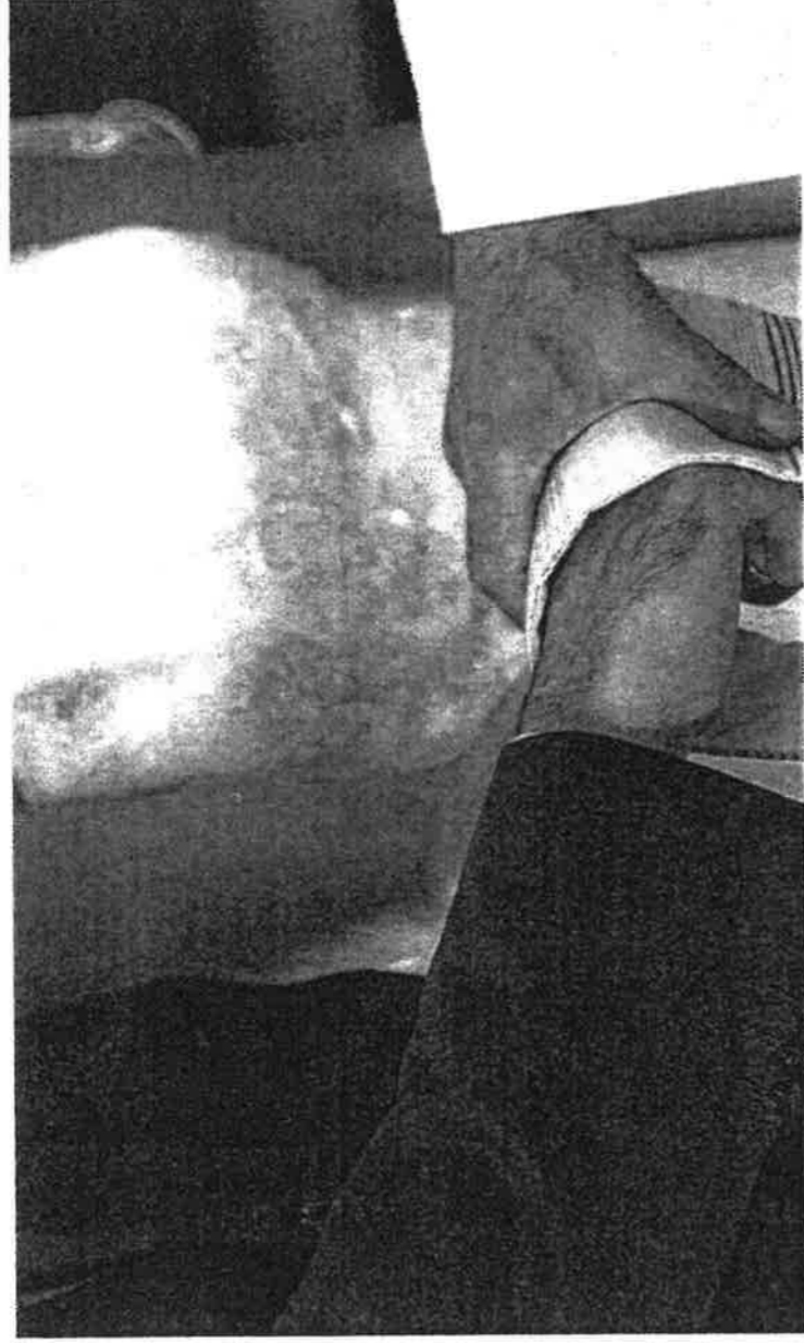
Das Band der Ehe kann durch die Kirche nur einmal geschlossen werden.